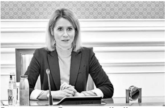
Вице-президент Еврокомиссии Кая Каллас

Сначала была дипломатия. А именно то, что «Казахстан первым из стран региона подписал соглашение о расширенном партнерстве и сотрудничестве с Европейским союзом, служит подтверждением высокого уровня развития двусторонних отношений». После этого Каллас сообщила о начале процедуры по заключению соглашения об упрощении порядка выдачи виз между Европейской комиссией и Казахстаном. На что Президент Касым-Жомарт Токаев заметил, что «в Казахстане воспринимают данную новость очень позитивно, поскольку этот шаг открывает широкие возможности для укрепления межличностных контактов и деловых связей с европейскими государствами».