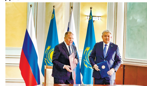
Россия признательна Казахстану за взвешенный подход к оценке украинского вопроса, заявил в четверг в Астане глава российского МИДа Сергей Лавров