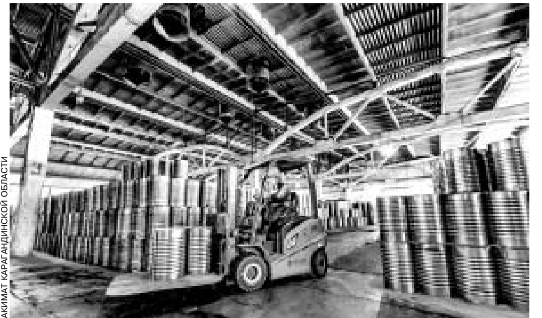
АКИМ КАРАГАНДИНСКОЙ ОБЛАСТИ

Корпус готов, оборудование поступает, идет его монтаж. Здесь будет организовано производство грузовых машин и спецтехники — сначала сборка, затем постепенный переход к более глубокой локализации. Еще один проект — производство крупной промышлен-