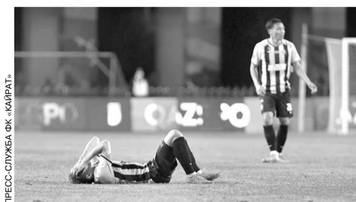
ПРЕСС-СЛУЖБА ФК «КАЙРАТ»

«Кайрат» потерял единоличное лидерство в КПЛ. Действующий чемпион встретил упорное сопротивление со стороны прямого конкурента «Елимая». Алматинцы остались на первом месте, но по набранным очкам с ними сравнялся «Ордабасы»