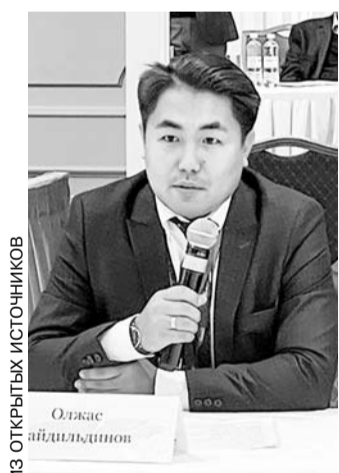
ИЗ ОТЧЕТЫХ ИСТОЧНИКОВ

«Все намного сложнее. Так, вся важная для нас электроника, автомобили из Китая идут в нашу республику не по железной дороге, а по морю: с восточного побережья Поднебесной, далее — через Персидский залив в Эмираты, а оттуда — уже к нам. И поскольку для Китая подорожает топливо из-за дорогой нефти, то подорожает в целом логистика, и естественно, что вырастут