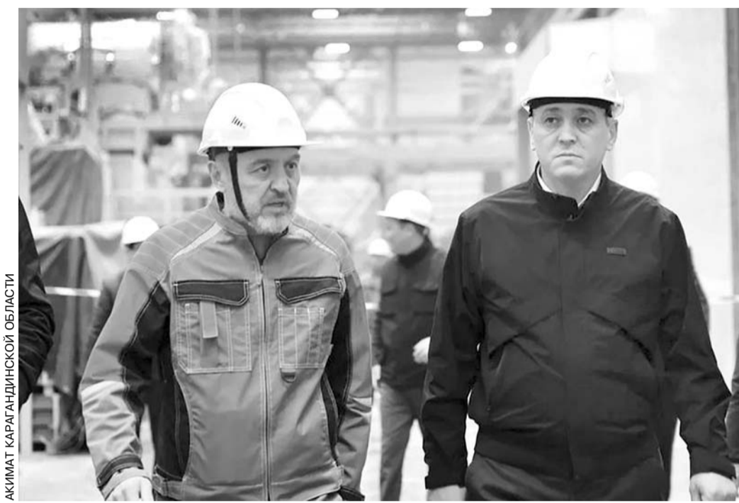
АКИМАТ КАРАГАНДИНСКОЙ ОБЛАСТИ

Выбор площадки не случаен: Осакаровский район расположен в зоне устойчивых ветров, особенно на участке Осакаровка — Сарыозек — Тельмана. Здесь уже реализуется ветроэнергетический проект мощностью 150 МВт.