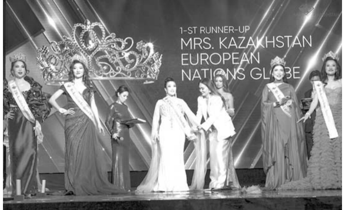
1-ST RUNNER-UP MRS. KAZAKHSTAN EUROPEAN NATIONS GLOBE

Mrs. Kazakhstan — это не только сцена, титулы и короны. Это проект о вере