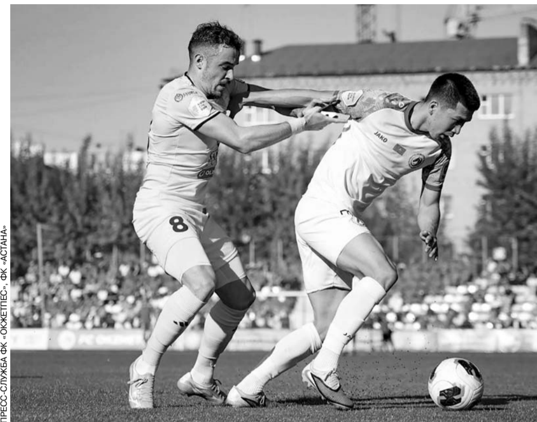
ПРЕСС-СЛУЖБА КК «ОКЖЕТПЕС» - КК «АСТАНА»