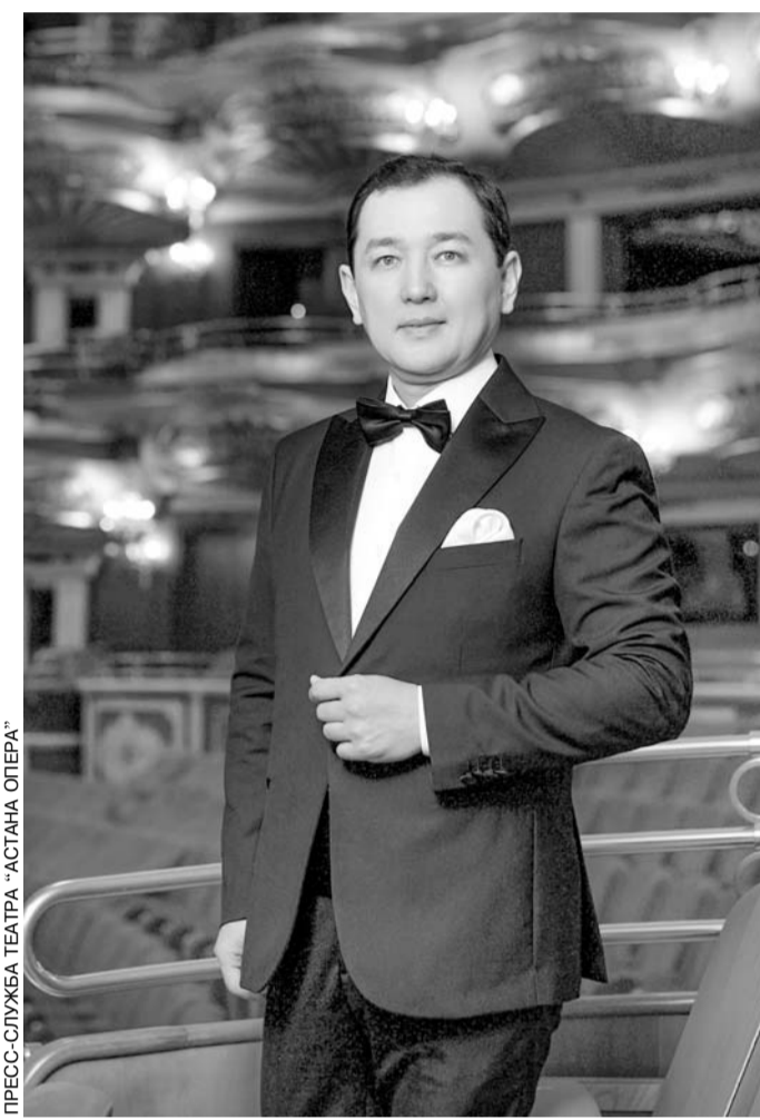
ПРЕСС-СЛУЖБКА ТЕАТРА «АСТАНА ОПЕРА»

ное, это энергия, физика, здоровые амбиции, ну а с годами все держится на безудержной любви, преданности высокому искусству, технике и эмоциональной наполненности. Главное для певца — быть в тоне, чтобы голос был всегда свежим и тембрально красивым. Баритон с хорошей школой может петь до 70 лет и больше. Иногда мне нужно просто посидеть в тишине, чтобы зарядиться, наполниться