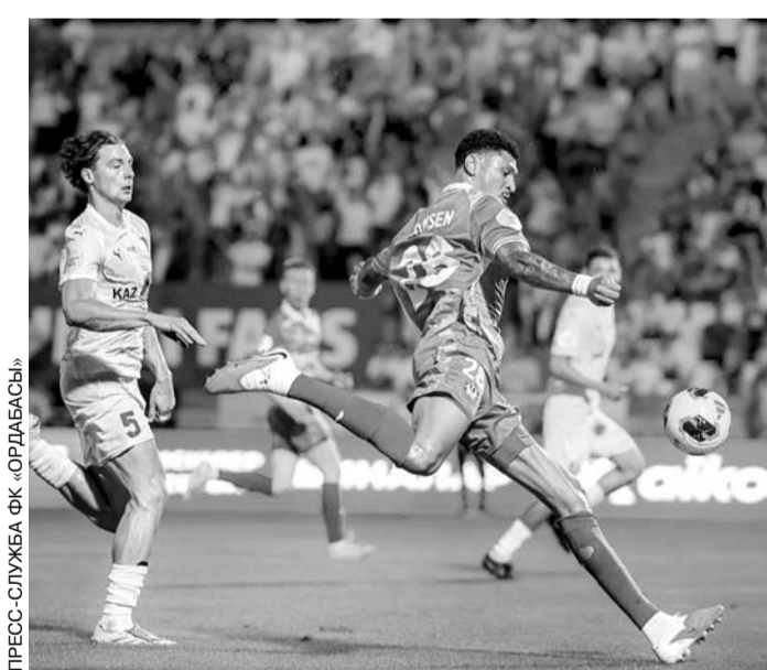
ПРЕСС-СПУЛЖА ФК ОРДАБАСЫ

Актыбинцы уверенно воспользовались преиму-