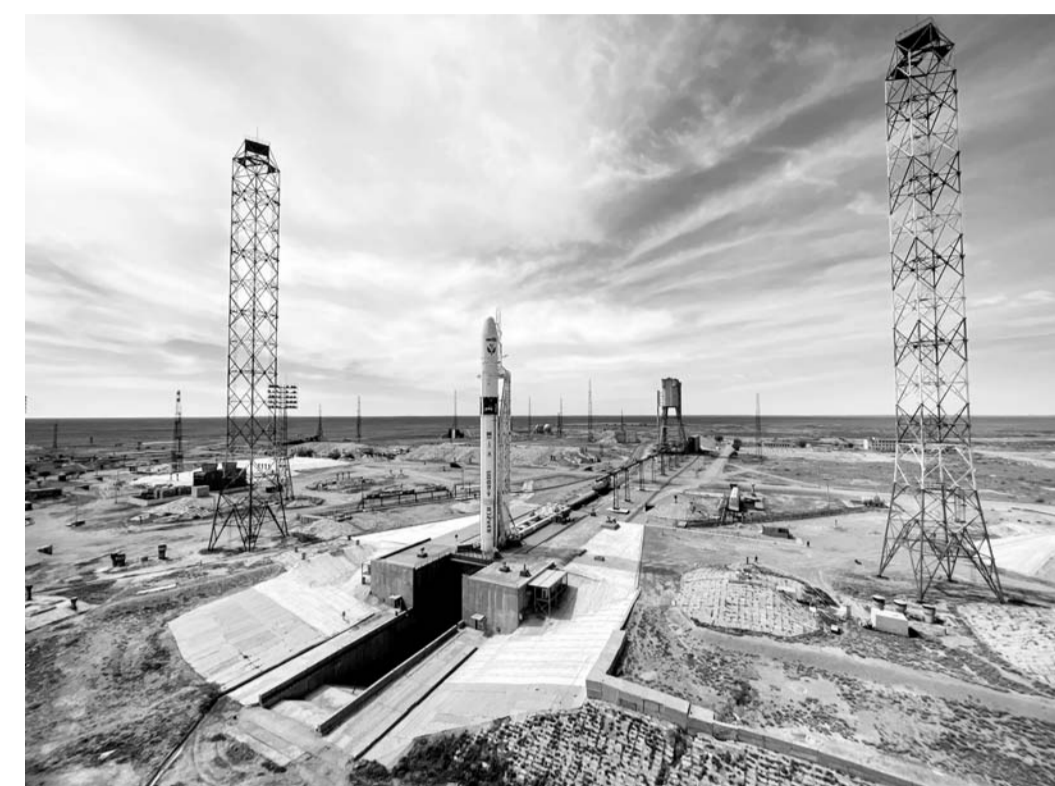
«Сункар» на старте

— Дефицит кадров — это общая болезнь всех площадок и комплексов. Сейчас принято решение о продолжении пусков «Протонов М». Знаете, людей набирают буквально единицами, потому что были значительные