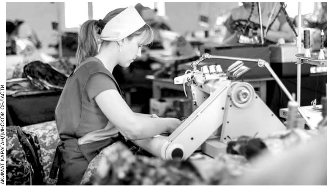
АКИМАТ КАРАГАНДИНСКОЙ ОБЛАСТИ

Акцент сделан на необходимости более тесного взаимодействия акиматов,