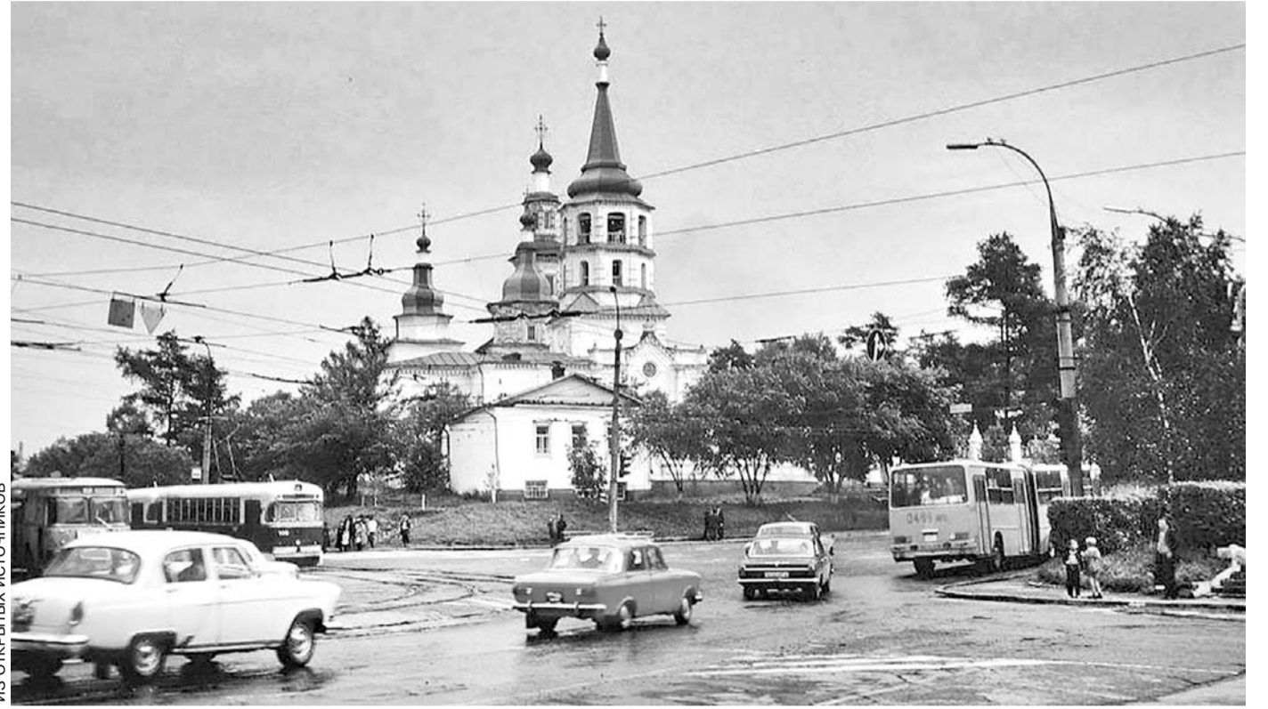
Иркутск в 1980-е годы

«У нас как среди солдат мода пойдя на какой-ни- будь предмет, так все сразу ищут у пленных, отбирают. Достал кто-то ручку налив- ую, у нас их еще не было,