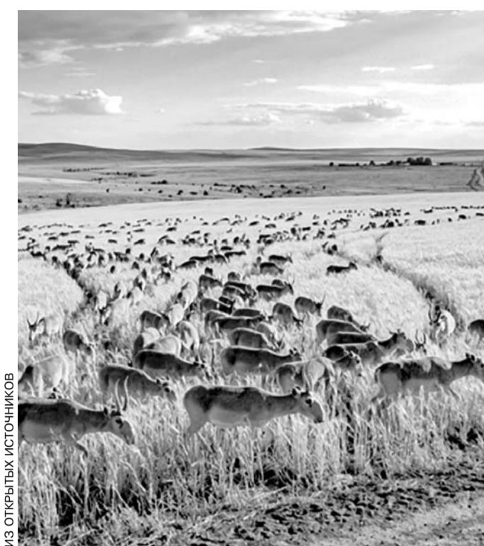
ИЗ ОТЧЕТЫХ ИСТОЧНИКОВ

Понятно, что каким-то одним инструментом данную проблему не решить. Здесь нужен комплекс мер. В первую очередь нужно пересмотреть выделенные фермерам земли. В 2022 году государством было инициировано проведение