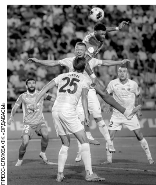
ПРЕСС-СЛУЖБА ФК «ОРДАБАСЫ»

минуте отправил мяч в ворота. Этот гол принес «Елимаю» важную выездную победу и четвертое место в таблице.