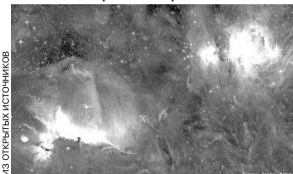
ПОЯС ОРИОНА. Фотография с Земли, полученная с большой выдержкой

И сегодня, как и века назад, нас пленяют звезды и планеты Солнечной системы. Спутник Земли Луна 28 января пройдет южнее Меркурия тонким серпом, переходя в новолуние 29 числа. Сразу около трех планет — Сатурна, Венеры и Нептуна — Луна пройдет 1 февраля, а 2 февраля достигнет перигея своей орбиты на расстоянии 367 457 километров от центра Земли.