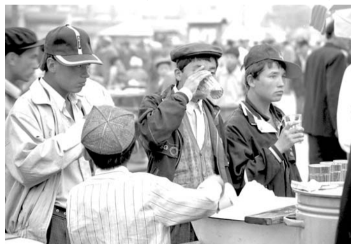
Именно таким я впервые увидел Кашгар четверть века назад.

Восток — та сакральная часть света, а вернее часть тьмы, из которой восходит (востекает) солнце. Освещающая разом испуганных загулялых джинов, доспающих на плоских кровлях сладкие сны газелеоких красавиц, кормящихся в плодоносных садах фиников-птиц, копошащихся на деревьях таинственных дэвов, спелых муздинов на минаретах, закованных в кольчуги воинов на предвратных башнях, бредущих с ночных бдений постов-дервишей. Вот он — зачарованный восточный город!