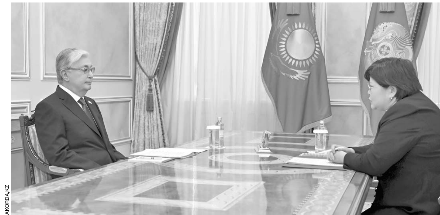
Президент РК Касым-Жомарт Токаев и председатель Конституционного суда Эльвира Азимова

По его словам, «в январе депутаты посетили 20 регионов страны и прове-