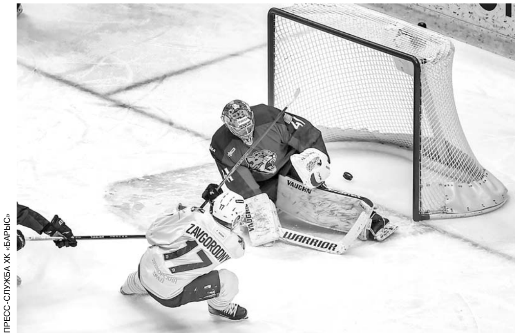
ПРЕСС-СЛУЖБА КХЛ «БАРЫС»

В заключительном домашнем матче января «Барыс» принимал «Адмирал». Встречу по медицинским причинам пропустил